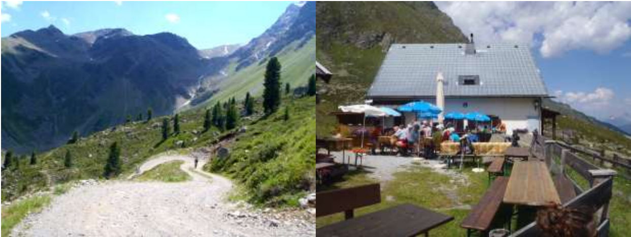
Am Ziel auf der Hütte